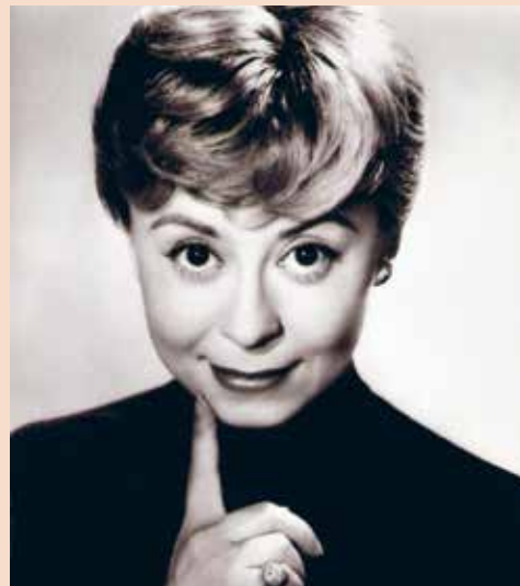
GIULIETTA MASINA Actrice Italienne

*Giulietta MASINA est une actrice italienne (22 février 1920 - 23 mars 1994). Connue comme la muse de Federico Fellini, qui trouve en elle son égale artistique, sa silhouette menue et son jeu la font interpréter des personnages naïfs évoluant dans des univers cruels. Giulietta MASINA est souvent appelée « le Chaplin féminin ». Épouse du réalisateur, elle joue dans sept de ses films dont le célèbre rôle de Gelsomina dans La Strada en 1954 qui la fait connaître mondialement.